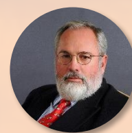
D. Miguel Arias Cañete Comisario de Energía, Comisión Europea